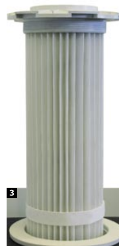
3 Multifit se vloží do otvoru v desce osazeného adaptérem