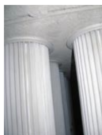
Pohled do komory osazené vložkami MULTIFIT