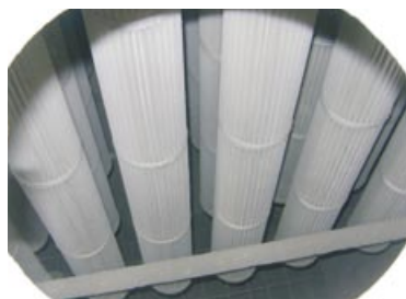
Pohled do komory osazené vložkami MULTIFIT