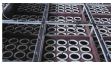
Osazení stávajícího kolektoru pro filtrační sáčky redukcí pro MULTIFIT