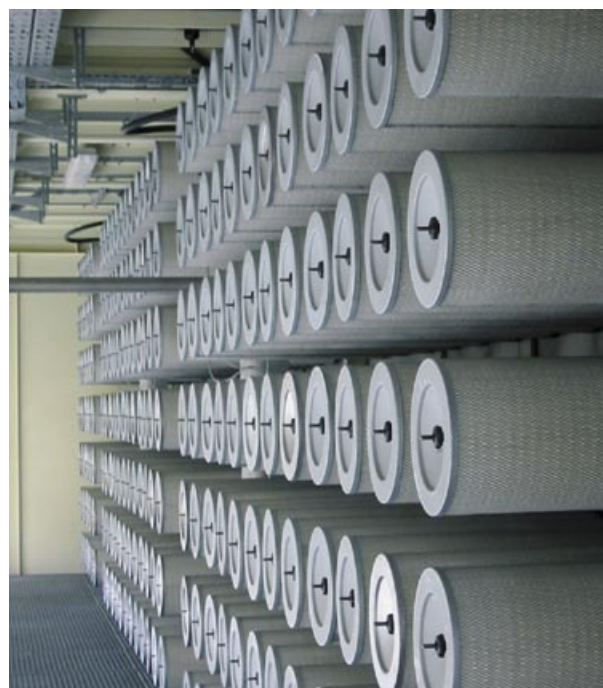
Filtrace plynové turbíny - osazení vložkami